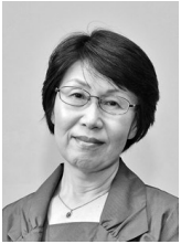
公益社団法人 日本精神保健福 祉士協会会長