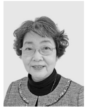
全国大会・ 学術集会長

我々は、前回の福島大会より、熱い思いのこもった貴重な「 たすき 襪」を受け取りました。精神保健福祉士の歴史的背景を踏まえ、めまぐるしい社会変容に伴う今こそ、精神保健福祉士としての基本的視点を再確認することや自分自身を見つめ直し、研鑽すること、当事者支援の姿勢や個人の尊厳を保ち、誠実に関わることの使命について考える機会にしたいと思っています。皆様のご参加を心よりお待ちしております。